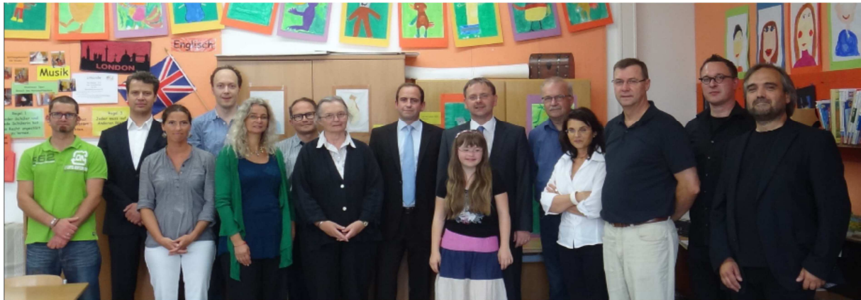
Abbildung 2: Am 10. Juli 2012 war die Konzeption der AG Sozialministerium abgeschlossen und die Umsetzung war im Fokus der Bemühungen.

Expertise optimal ein. Die gemeinsame Arbeit erfolgte in einem Vertrauensverhältnis und alle hatten wir schlussendlich eine gemeinsame Vision. Von Seiten der Eltern entwickelte sich diese gemeinsame Vision an der Sitzung im Dezember 2011, als wir Eltern kurz davor waren, die Arbeitsgemeinschaft zu verlassen. Denn die Eltern waren der Meinung, dass es zu dem zu diesem Zeitpunkt zur Diskussion stehenden Modell keine Kinder geben würde. Im Januar 2012 wurde bei den Eltern der Partnerklassenkinder in München eine Befragung (ca. 75 Eltern) durchgeführt 3 . Als Ergebnis konnte festgehalten werden (ca. 60% haben eine Rückmeldung gegeben), dass eine gemeinsame Nachmittagsbetreuung von Regel- und Förderschülern und Schülerinnen gewünscht wird. Bereits ab Mai 2012 starteten die ersten Leistungs- und Entgeltverhandlungen mit dem Bezirk Oberbayern und am 1. Juni 2012 die Kooperationsverhandlungen mit dem Träger der Förderschule. Obwohl es mit den Personaleinstellungen durch die Mittagsbetreuung für die Tandemklasse an der Grundschule und die Offene Ganztageschule der IG Feuerwache für die Partnerklasse an der Mittelschule am Ende sehr eng war, konnte unser neues inklusives Nachmittagsmodell termingerecht zum 17. September 2012 an den Start gehen.